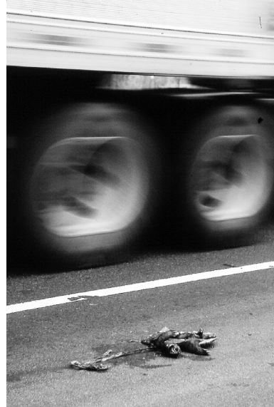
Une tortue serpentine qui se déplaçait dans la plaine montérégienne...

améliorés afin de soutenir les efforts de conservation passés, présents et futurs. Par exemple, les habitats essentiels des espèces désignées « menacées » ou « vulnérables » ne sont pas protégés adéquatement par la législation québécoise. La nouvelle loi fédérale sur les espèces en péril pourra-t-elle prendre la relève? Signe des temps, la mauvaise presse associée aux moustiques, parfois porteurs du virus du Nil occidental, complique aussi les efforts de conservation des milieux humides dans le sud du Québec. Il demeure malgré cela une certitude herpétologique: si nous n'entreprenons rien de façon concertée en Montérégie, bientôt ces îlots verts s'appauvriront et se transformeront en prisons vertes! Des prisons vertes dans le désert montérégien!