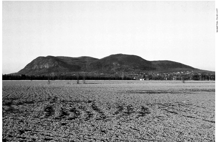
L'agriculture industrielle intensive en Montérégie

ont pour l'instant survécus aux activités humaines entre ces Montérégiennes, doit faire partie intégrante de nos efforts de conservation à court terme (Bastien et al. , 2002). Des activités d'intendance privée (Girard, 2000) et d'autres options de conservation (Longtin, 1996) sont d'ailleurs mises en place dans quelques secteurs, avec l'aide de partenaires locaux. Nous sommes présentement en voie d'adapter des concepts de conservation reconnus afin d'intervenir efficacement dans certains de ces milieux (tableau 2). La création et la