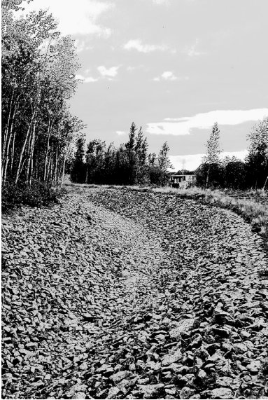
Ouvrage de contrôle des eaux de ruissellement au mont Saint-Hilaire