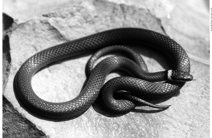
La couleuvre à collier subsiste toujours sur le mont Royal.

peu probable étant donné son isolement important et la perte d'habitats sur ses flancs. Par ailleurs, l'agriculture industrielle, telle la production porcine et son association à la monoculture du maïs, constitue actuellement l'une des plus importantes menaces à la préservation de la biodiversité pour toute la plaine montréalaise, par ses impacts directs et indirects sur les habitats fauniques (Société de la faune et des parcs du Québec, 2002). Bien que beaucoup moins surprenant, nous observons une situation encore plus dramatique sur le mont Royal, où il ne subsiste qu'un seul milieu humide naturel. Cet habitat totalement isolé supporte in extremis l'une des deux espèces d'amphibiens toujours présentes sur la montagne.