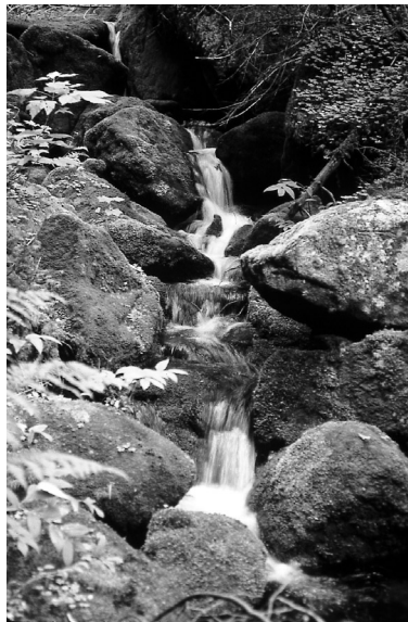
Le mont Mégantic, une colline encore sauvage !

La plaine montérégienne au sud de Montréal est quant à elle dominée par cinq autres collines : les monts Saint-Bruno, Saint-Hilaire, Saint-Grégoire, Rougemont et Yamaska. Ces « refuges verts » évoluent dans un paysage dominé par l'agriculture intensive et l'urbanisation croissante. Les monts Brome et Shefford suivent ensuite, dans les Cantons-de-l'Est, dans un décor beaucoup plus naturel. La plus orientale et la plus haute des collines, le mont Mégantic, complète enfin le tableau avec ses 1 105 m d'altitude et son célèbre observatoire astronomique de recherche. Malgré leurs différences, toutes les Montérégiennes possèdent encore un très riche patrimoine faunique et floristique en ce début de XXI e siècle. Mais pour combien de temps encore ?