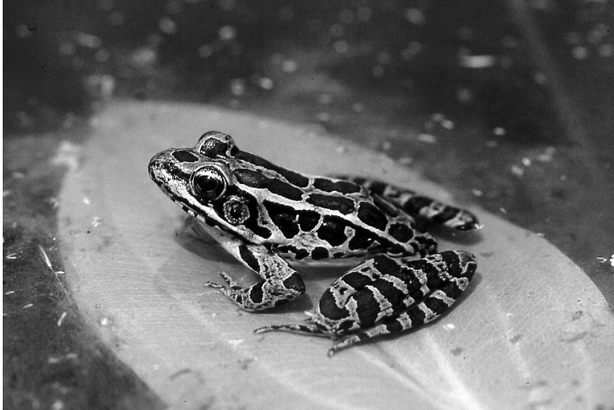
La grenouille des marais est une espèce isolée sur le mont Saint-Hilaire.