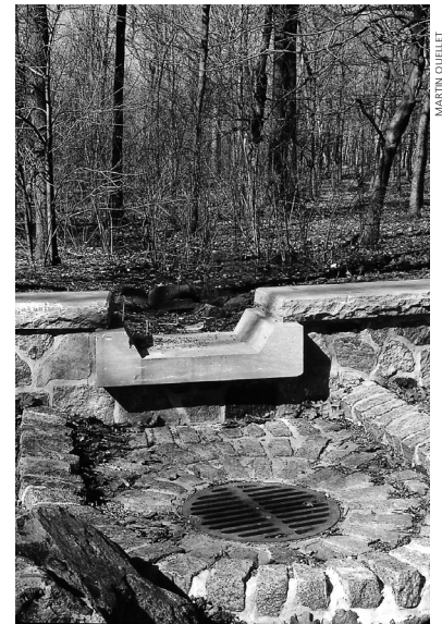
Une colline mal apprivoisée : le mont Royal