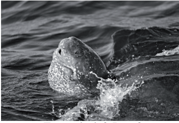
Tortue luth à Percé

La tortue luth ( Dermochelys coriacea ) a une carapace qui mesure jusqu'à 2 m de long et un poids total pouvant atteindre 900 kg. C'est un reptile marin remarquablement bien adapté pour fréquenter tant les eaux tropicales que les eaux froides des régions nordiques. Son aire de répartition est donc très vaste. Dans l'Atlantique nord-ouest, cette espèce est observée notamment au Québec, et à l'occasion dans le secteur de Percé, durant la saison estivale. La tortue luth est une espèce menacée au niveau mondial.