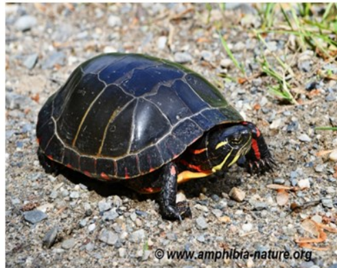
Une tortue peinte adulte observée sur le bord d'un chemin de gravier.

Vous pouvez signaler vos observations à Amphibia-Nature qui confirmera l'identification de l'espèce et pourra répondre à vos questions. Tout signalement, récent ou passé, est pertinent s'il est accompagné d'une photo, d'une date et d'un lieu d'observation. Ces données permettront d'accroître nos connaissances sur la répartition des espèces et seront utiles à des fins de conservation des habitats et de sensibilisation du public.