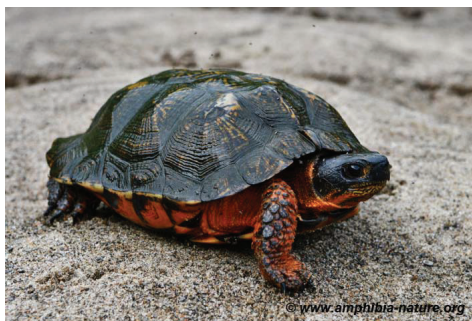
Une tortue des bois en déplacement.