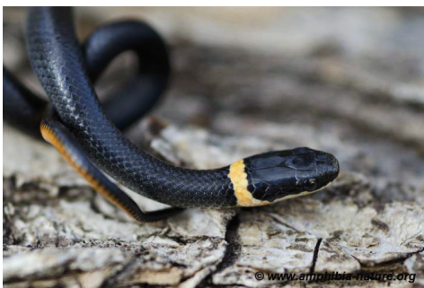
Une couleuvre à collier du Nord.

Vous pouvez signaler vos observations à Amphibia-Nature qui confirmera l'identification de l'espèce et pourra répondre à vos questions. Tout signalement, récent ou passé, est pertinent s'il est accompagné d'une photo, d'une date et d'un lieu d'observation. Ces données permettront d'accroître nos connaissances sur la répartition des espèces et seront utiles à des fins de conservation des habitats et de sensibilisation du public.