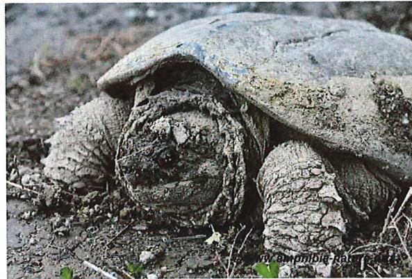
Une tortue serpentine sur le bord d'une route.