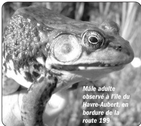
Mâle adulte observé à l'île du Havre-Aubert, en bordure de la route 199