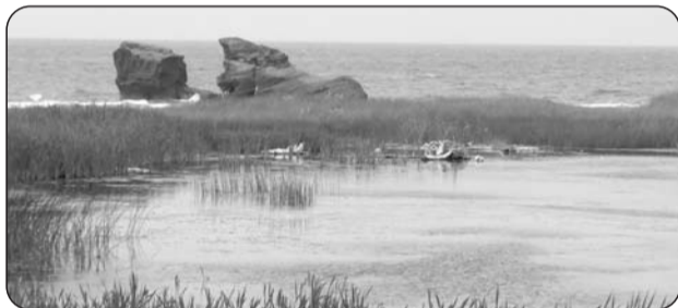
Marais situé en bordure du chemin de l'Étang des Caps, île du Havre-Aubert. La grenouille verte a été entendue à cet endroit.