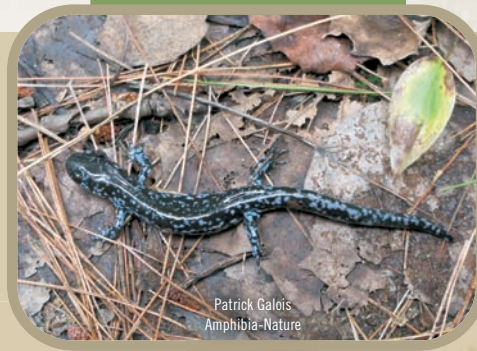
Salamandre à points bleus